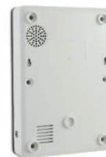
Fissaggio a muro