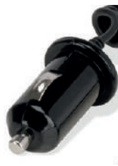
Cavo per Auto